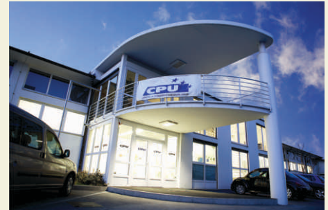
Poslovna stavba CPU, Kardeljeva ploščad 27a, Ljubljana